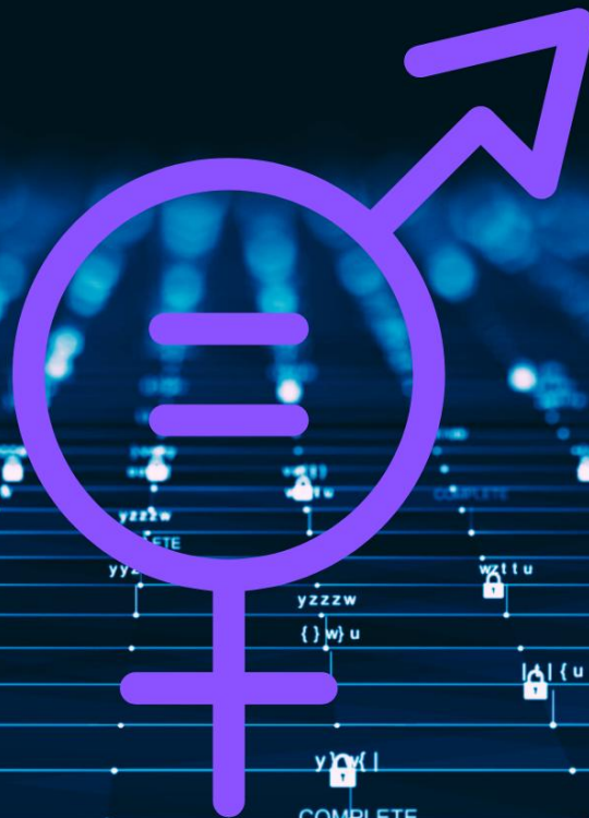
Illustration cybersecurity by TU IS